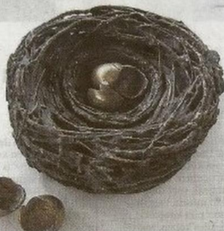
Marloes Eerden, 'Empty nest',